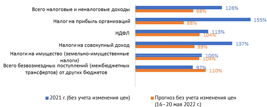
Рис. 3. Темпы роста основных статей доходов консолидированных бюджетов субъектов Российской Федерации, % к предыдущему году