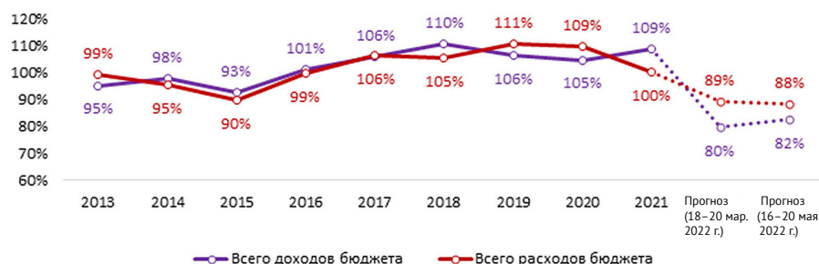
Рис. 4. Темпы роста доходов и расходов консолидированных бюджетов регионов России с учетом изменения цен, % к предыдущему году

Эксперты отмечают, что ухудшение бюджетной ситуации отмечается в большинстве регионов страны. Наиболее проблемными могут стать