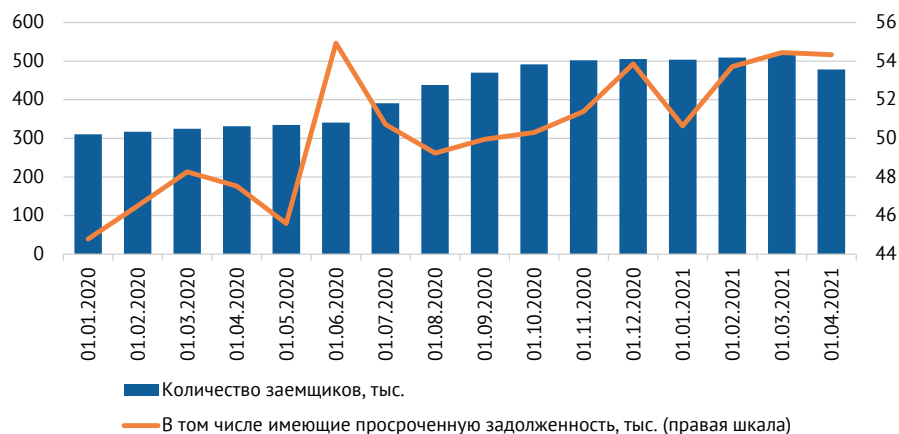
Рис. 1. Количество юридических лиц – резидентов и индивидуальных предпринимателей, имеющих задолженность (включая просроченную) в 2020–2021 гг.