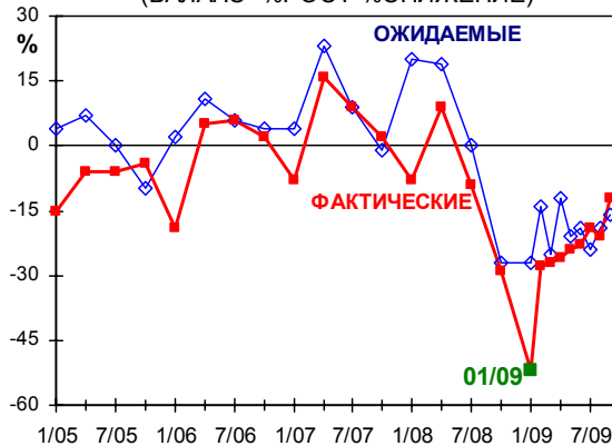
ИЗМЕНЕНИЯ ЗАНЯТОСТИ (БАЛАНС=%РОСТ-%СНИЖЕНИЕ)

В планах предприятий все так же больше намерений сократить персонал, чем его увеличить. По сравнению с августом принципиальных изменений в целом по промышленности здесь не зарегистрировано. Самые интенсивные увольнения возможны в стройиндустрии, машиностроении, леспроме, химии и нефтехимии.