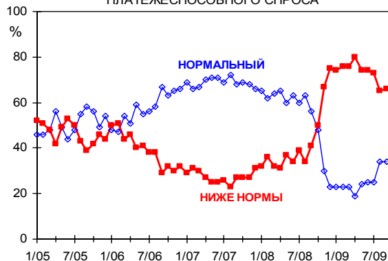
ДИНАМИКА ОСНОВНЫХ ОЦЕНОК ПЛАТЕЖЕСПОСОБНОГО СПРОСА

демонстрируют выход российской промышленности на новый уровень восприятия ситуации. Второй месяц подряд нормальным считают спрос на свою продукцию треть российских предприятий. Ранее (в течение предыдущих восьми кризисных месяцев) такого мнения придерживалась только четверть производителей. Самая высокая удовлетворенность продажами в августе-сентябре отмечена в цветной металлургии (62% предприятий), пищевой (55%) и химической (45%) отраслях.