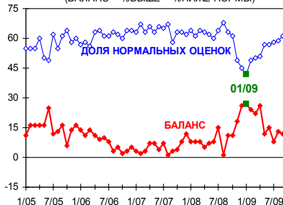
БАЛАНС ОЦЕНОК ЗАПАСОВ ГОТОВОЙ ПРОДУКЦИИ (БАЛАНС = %ВЫШЕ – %НИЖЕ НОРМЫ)

Баланс оценок запасов готовой продукции с мая 2008 г. составляет в среднем +12 пунктов и определенно вышел на уровень разумной достаточности, характерной для 2004 – первой половины 2006 гг., периода не самого высокого разогрева российской промышленности. На уровень указанного периода вышла и доля предприятий с нормальными запасами готовой продукции. Таким образом, с каждым месяцем все очевиднее становится вывод о том, предприятия справились с проблемой избытка запасов, а стабилизация их оценок говорит об отсутствии у них желания работать на склад в предвкушении скорого возврата к прежним темпам роста продаж и поддержания таким способом показателей официальной статистики выпуска.