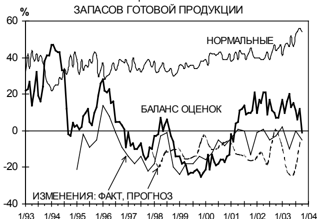
БАЛАНС ОЦЕНОК=%ВЫШЕ-%НИЖЕ НОРМЫ ИЗМЕНЕНИЯ=%РОСТ-%СНИЖЕНИЕ