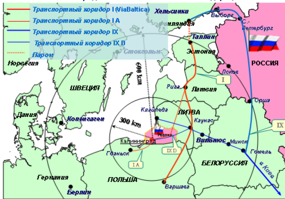
Калининградская область Российской Федерации

Территория за свою историю уже третий раз имеет оторванное от остальной части государства географическое положение: