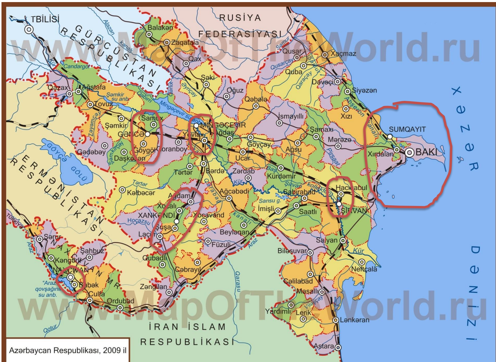
Azərbaycan Respublikası, 2009 il