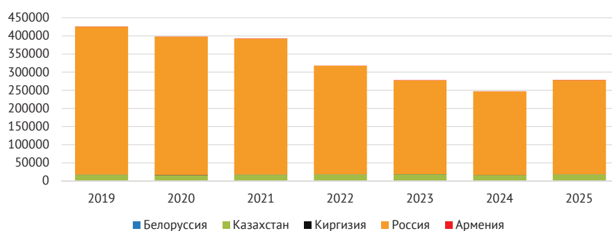
Рис. 3. Исходящие ППИ (запас) из стран ЕАЭС в 2019–2025 гг., млн долл.

Высокую инвестиционную активность стран ЕАЭС также можно отметить и в других странах СНГ. В частности, Узбекистан и Грузия являются крупнейшими направлениями для привлечения казахстанского капитала. В 2025 г. при участии казахстанской инвестиционной группы PTC Holding введен в эксплуатацию портовый терминал в Потти (Грузия). Стоимость проекта оценивается в 32 млн долл. 5 Также важным инвестиционным партнером для Грузии среди стран ЕАЭС является Армения. Компания «Гранд Холдинг»