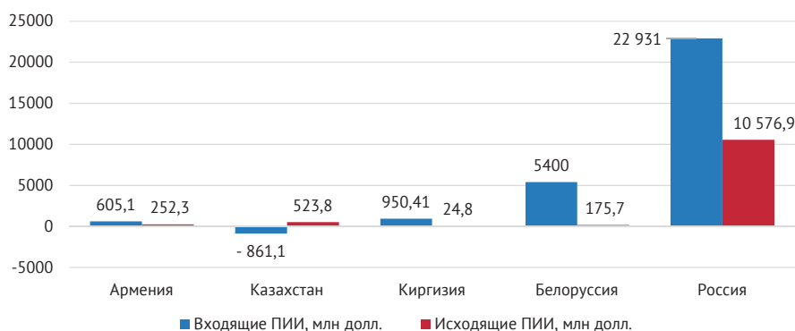
Рис. 1. Входящие и исходящие ПИИ в странах ЕАЭС в 2025 г. (поток), млн долл.

В 2025 г. обозначился тренд на повышение интенсивности инвестиционной активности в ЕАЭС после спада с 2022 г. за счет роста как входящих, так и исходящих прямых иностранных инвестиций (ПИИ), главным образом в России (рис. 1).