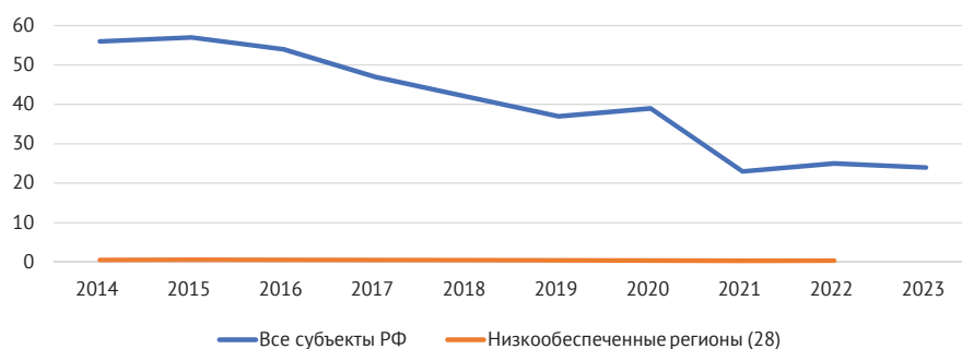
Рис. 2. Число субъектов Российской Федерации с уровнем долговой нагрузки более 50% в 2014–2023 гг.