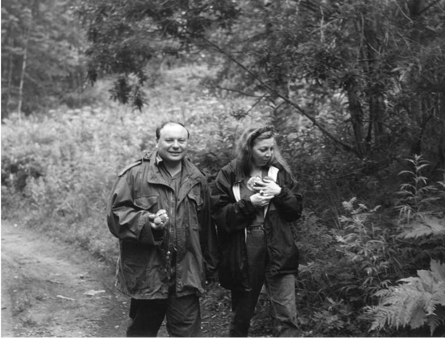
Мария Стругацкая и Егор Гайдар. Камчатка, август 1995 г.