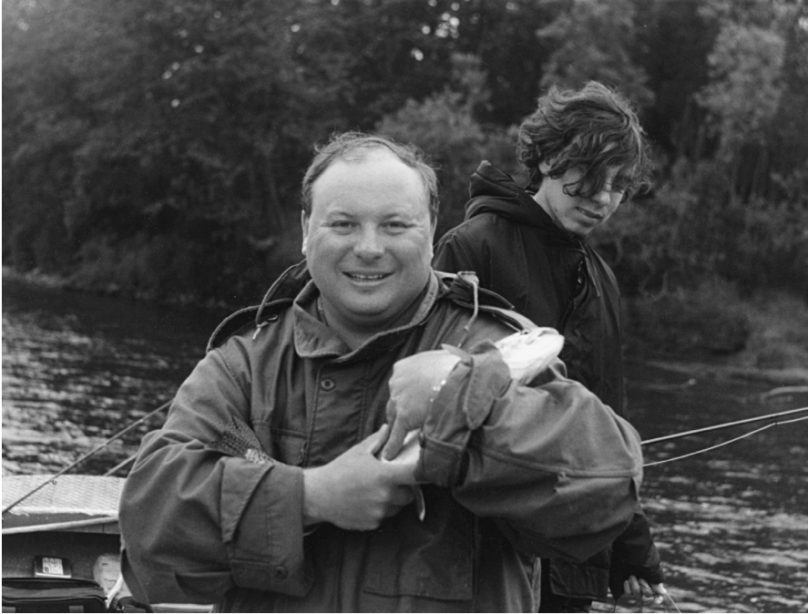
Е. Т. Гайдар с сыном Иваном. Камчатка, 1995 г.