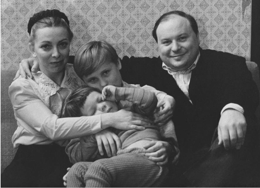
Мария Стругацкая и Егор Гайдар с сыновьями Петром и Павлом. Москва, 1992 г.