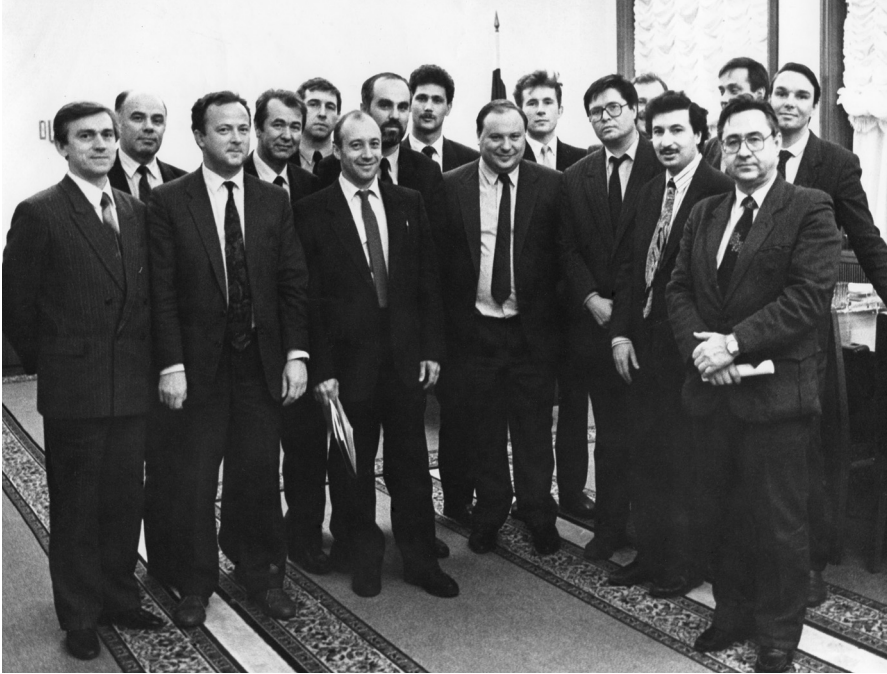
Последний снимок в кабинете Премьера. Гайдар и его команда. Декабрь 1992 г.