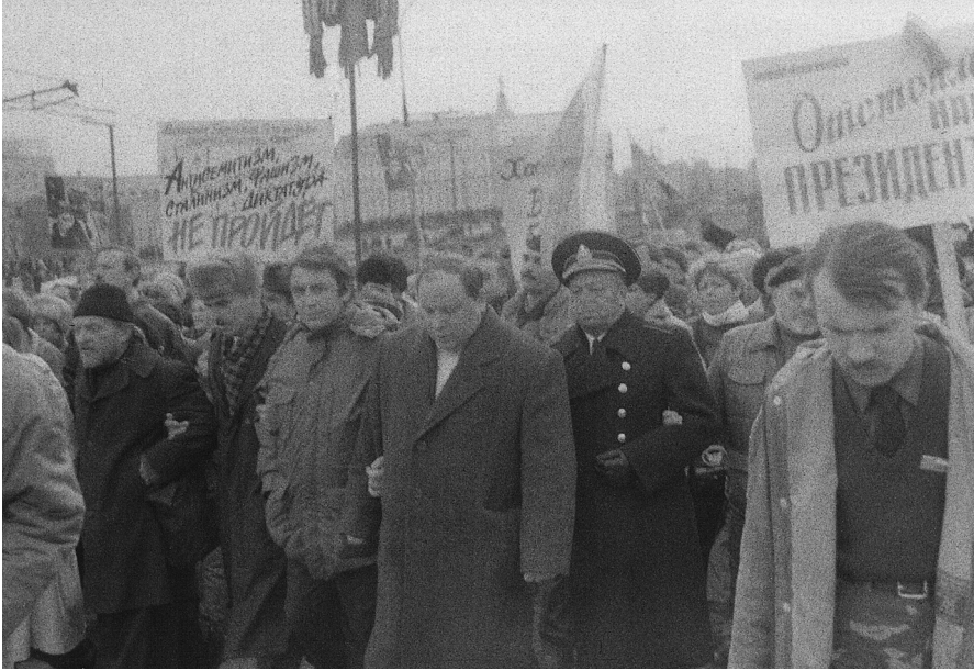
Митинг в поддержку Б.Н. Ельцина. Москва, март 1993 г.