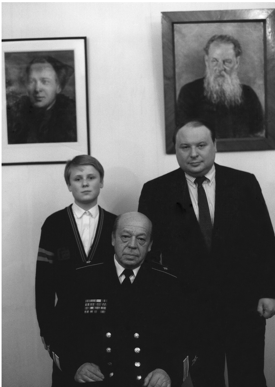
Три поколения Гайдаров. Январь 1994 г.