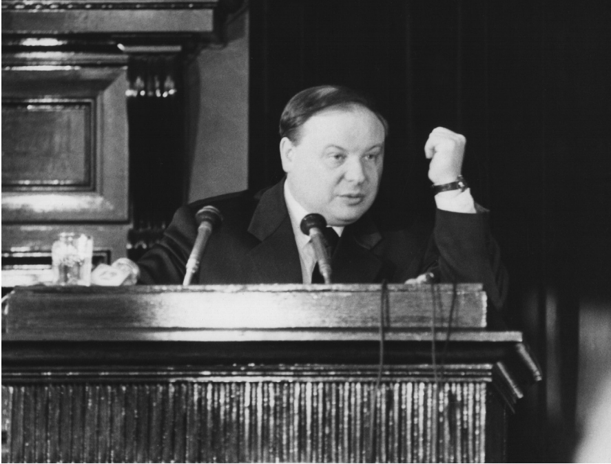
Седьмой съезд народных депутатов Российской Федерации. Москва, декабрь 1992 г.