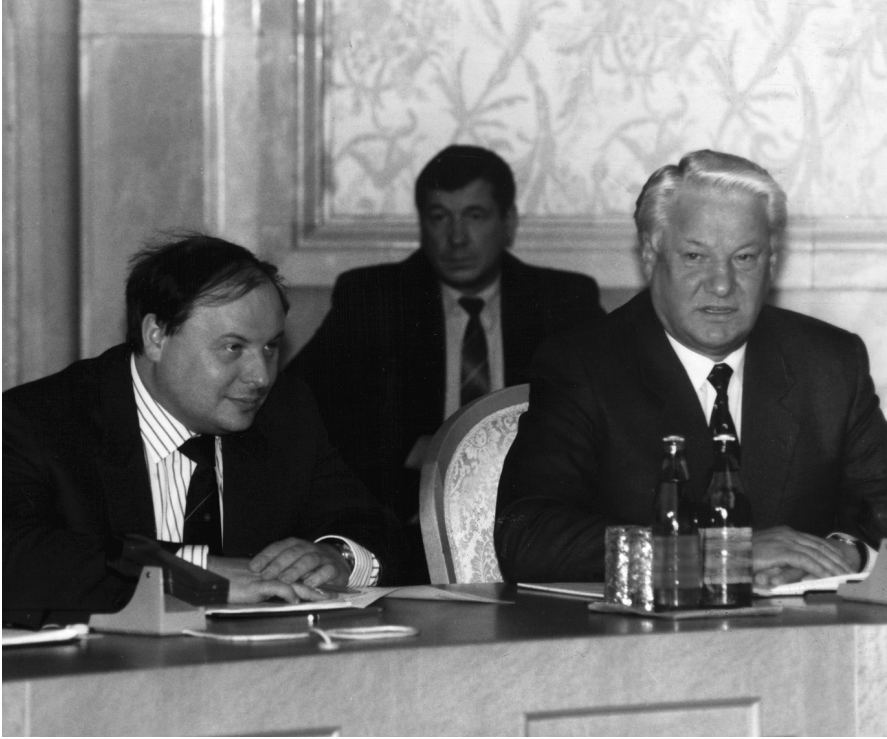
Е.Т. Гайдар и Б.Н. Ельцин. Москва, Кремль, 1992 г.