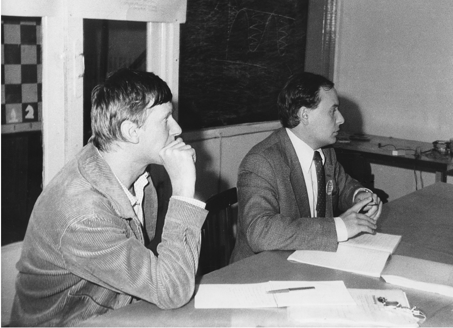
А.Б. Чубайс и Е.Т. Гайдар. На экономическом семинаре в пансионате «Змеиная горка». Ленинградская область, август 1986 г.