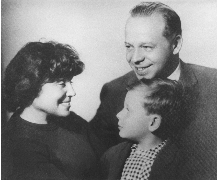
Егор Гайдар с отцом и бабушкой. 1956 г.