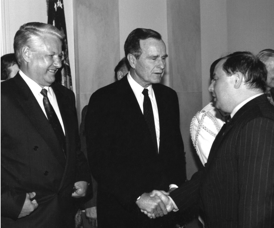
Б.Н. Ельцин, Дж. Буш, Е.Т. Гайдар. Вашингтон. Белый дом. 16 июня 1992 г.