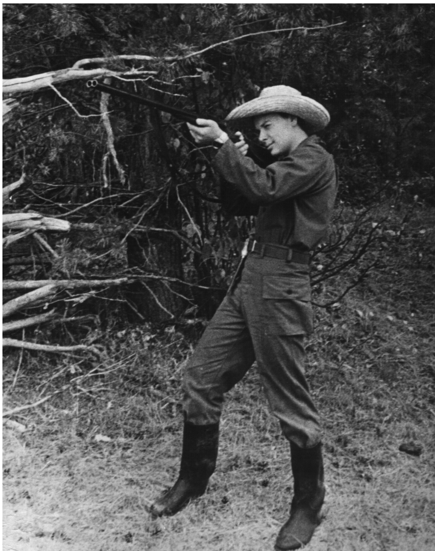
Егор Гайдар. Река Ветлуга, 1974 г.