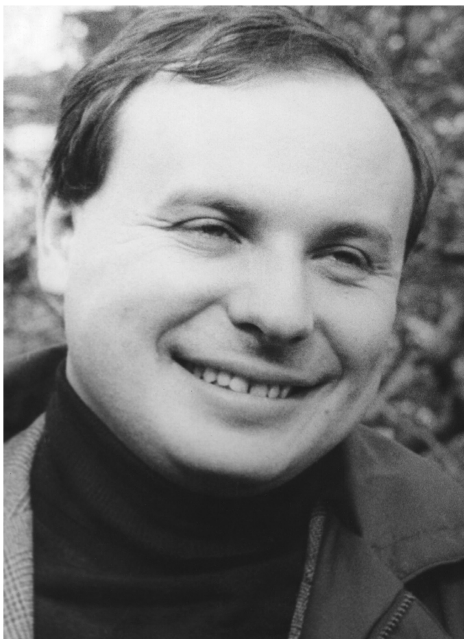
Е. Т. Гайдар. Рославль Смоленской области. 1985 г.