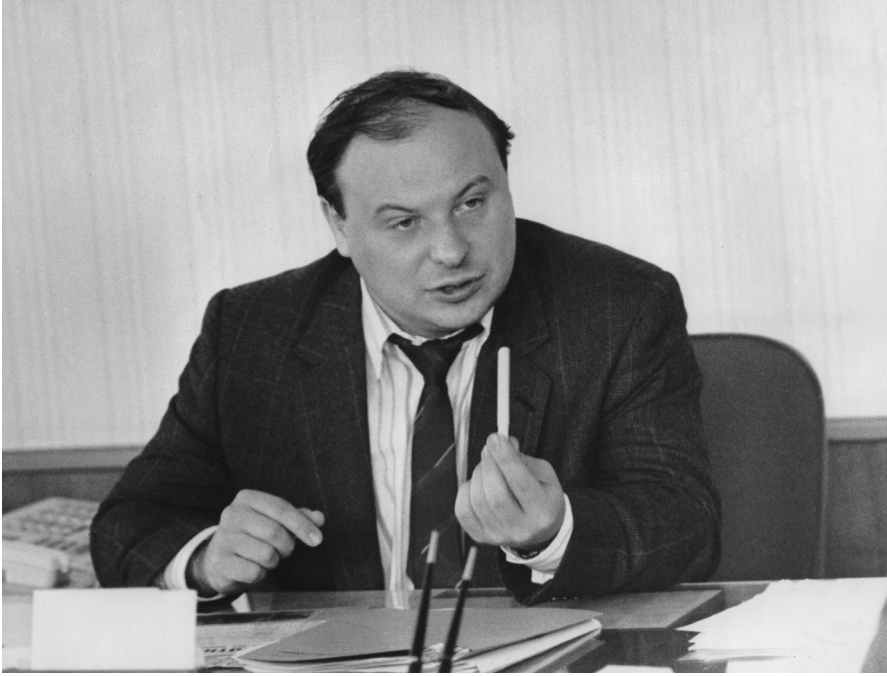
Зима 1991–1992 зз.