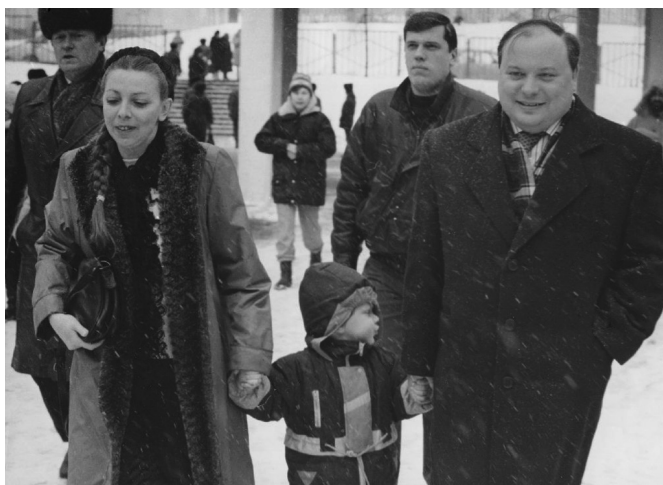
Все на выборы. 12 декабря 1993 г.