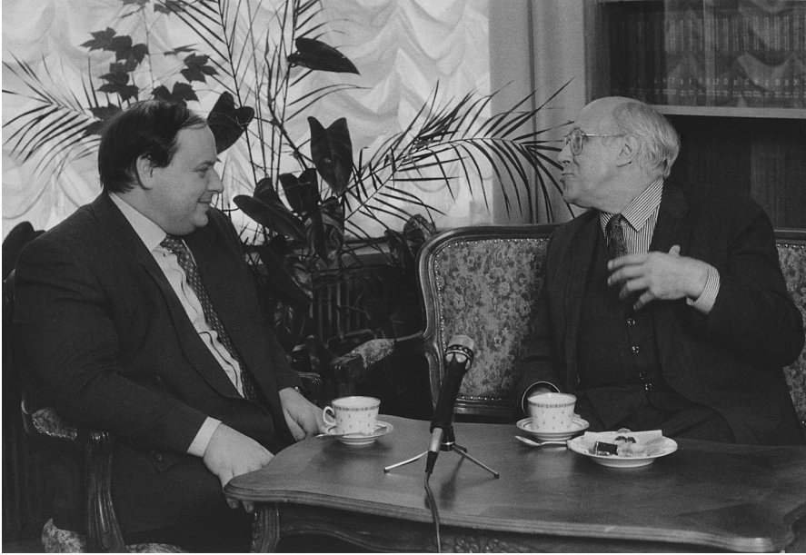
Е.Т. Гайдар и М.Л. Ростропович. Москва, 1992 г.