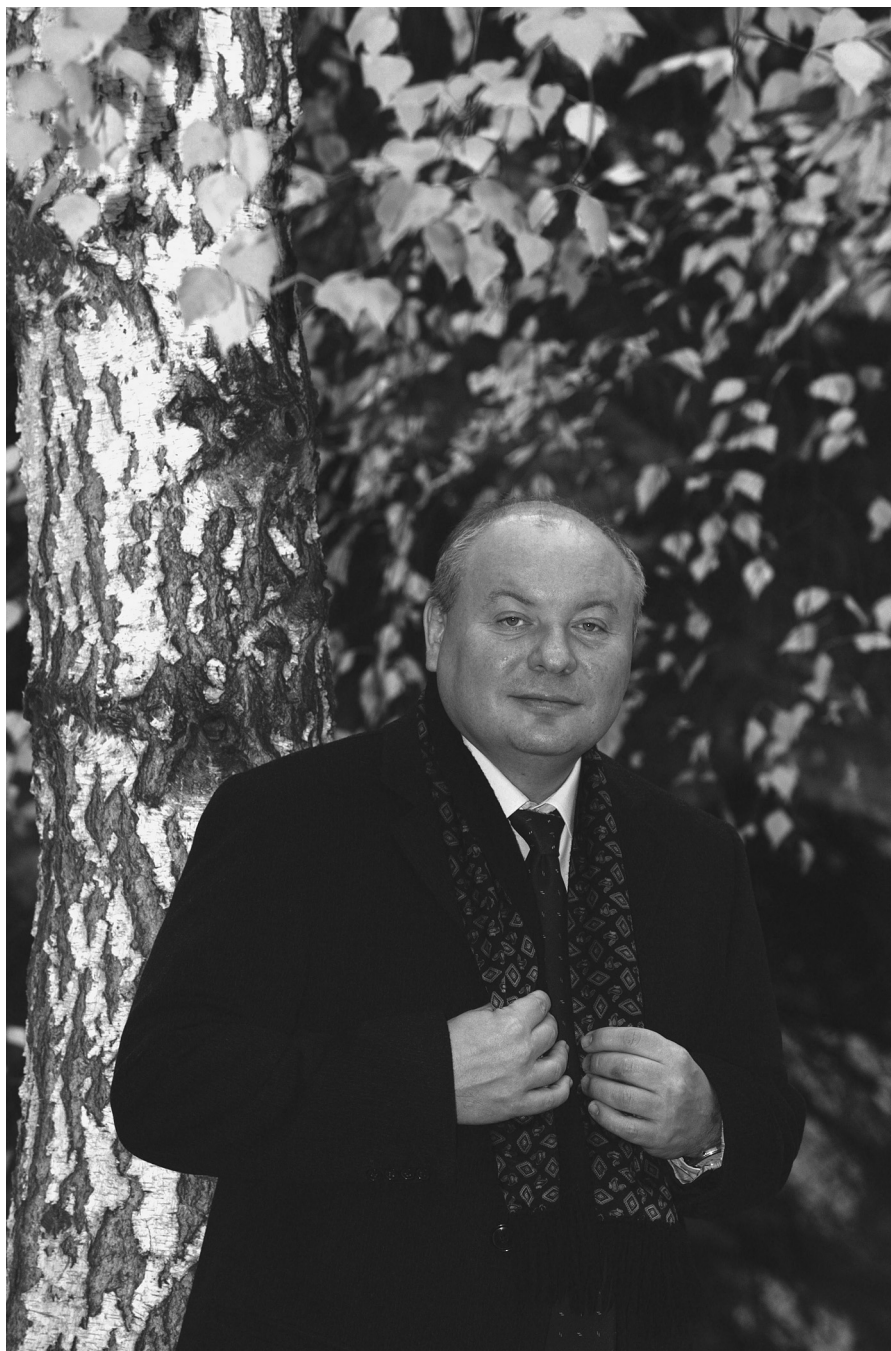
Е.Т. Гайдар. Москва, октябрь 2006 г.