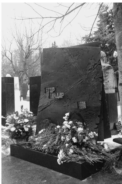
Открытие памятника Е.Т. Гайдару. Новодевичье кладбище. 16 декабря 2010 г.