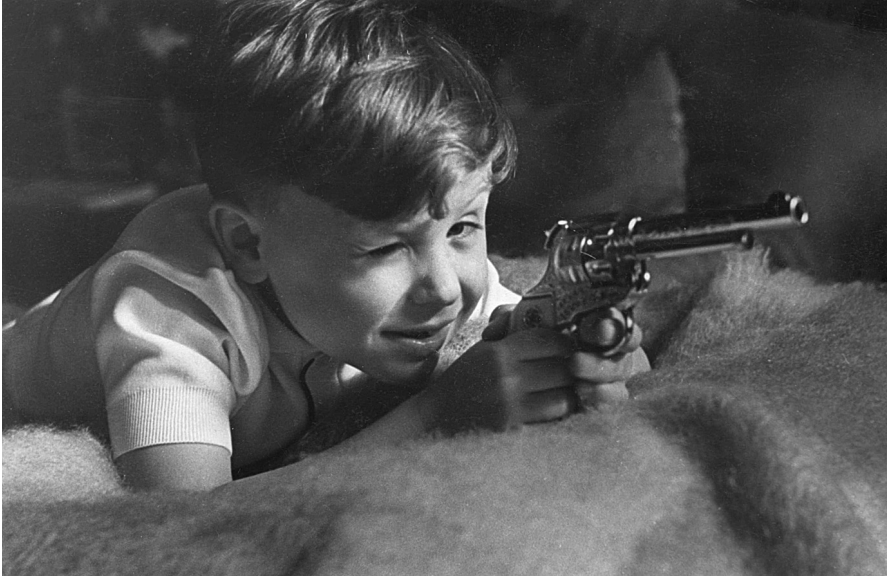
Егор Гайдар. Москва, 1961 г.