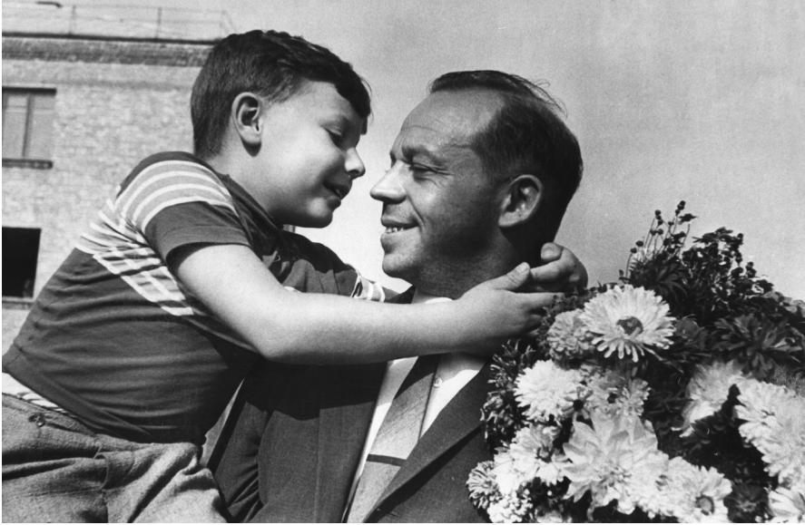
Тимур Аркадьевич Гайдар с сыном Егором. Москва, 1960 г.