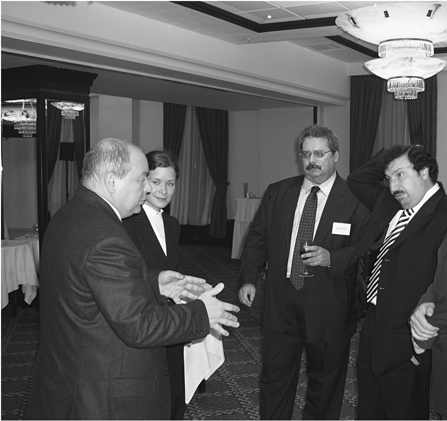
Е.Т. Гайдар, М.Е. Гайдар, С.В. Приходько, В.А. Мау. Празднование 30-летия Академии народного хозяйства при Правительстве Российской Федерации. Москва, 26 октября 2007 г.