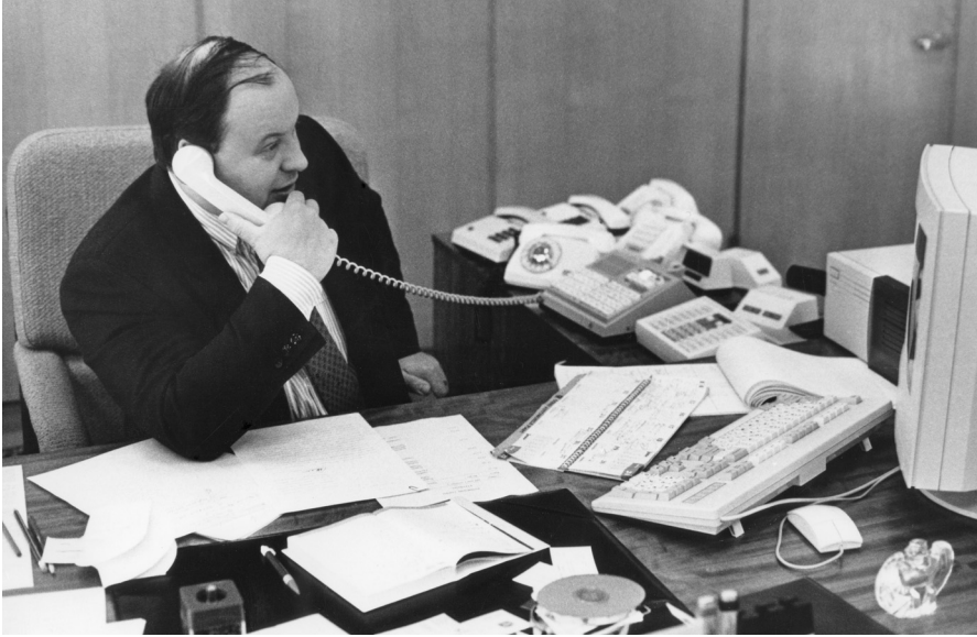
Е.Т. Гайдар в кабинете Института экономических проблем переходного периода. Москва, 1993 г.