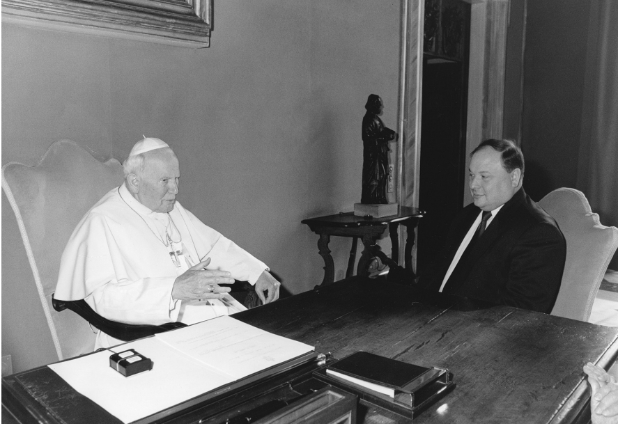
Папа Иоанн Павел II и Е.Т. Гайдар. Ватикан, 1999 г.