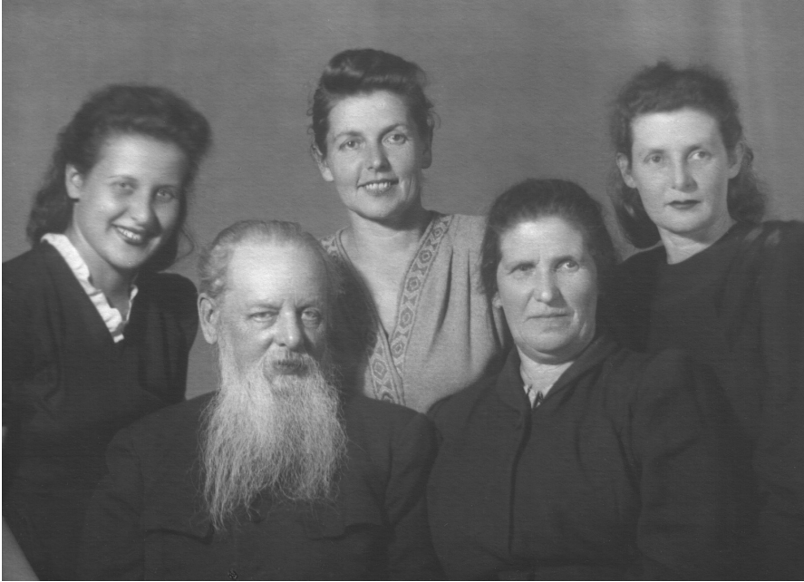
Павел Петрович Бажов с женой и дочерьми. Свердловск, 1952 г.