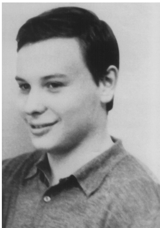
Егор Гайдар. Москва, 1971 г.