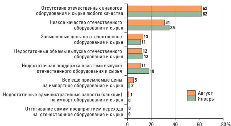
РИС. 2. ПОМЕХИ ИМПОРТОЗАМЕЩЕНИЮ ДЛЯ РОССИЙСКИХ ПРОМЫШЛЕННЫХ ПРЕДПРИЯТИЙ В 2015 Г., %