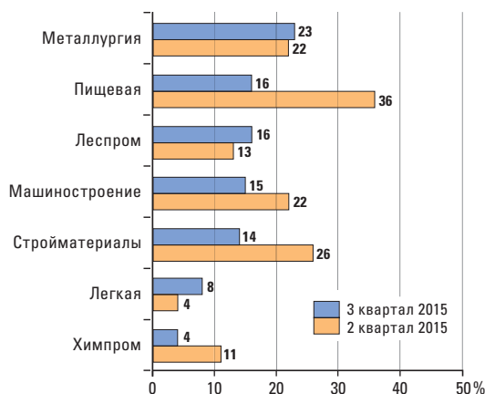
РИС. 4. МАСШТАБЫ ФАКТИЧЕСКОГО ИМПОРТОЗАМЕЩЕНИЯ ПРИ ЗАКУПКАХ СЫРЬЯ И МАТЕРИАЛОВ В ОТРАСЛЯХ ПРОМЫШЛЕННОСТИ, %