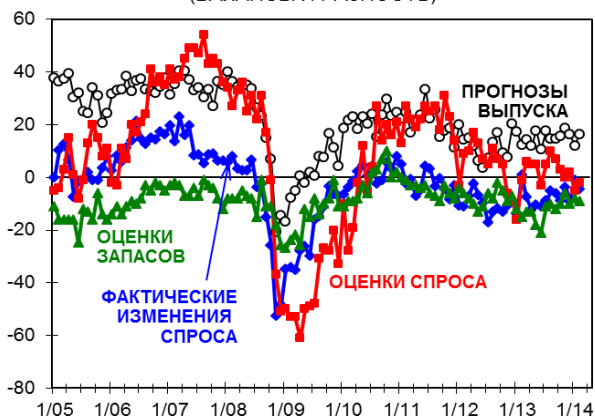
ИНДЕКС ПРОГНОЗОВ ПРОМЫШЛЕННОСТИ, 2005-2014 гг.