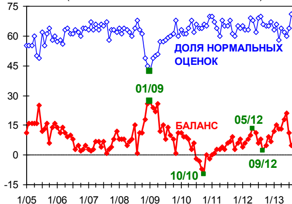
БАЛАНС ОЦЕНОК ЗАПАСОВ ГОТОВОЙ ПРОДУКЦИИ (БАЛАНС = %ВЫШЕ -- %НИЖЕ НОРМЫ)

Оценки запасов готовой продукции продолжают демонстрировать положительные изменения. Баланс этого показателя снизился (т.е. улучшился) в августе на 6 пунктов после июльского снижения на 10 пунктов. Таким образом, июньский взлет избыточности запасов готовой продукции за два месяца успешно купирован, и сейчас баланс их оценок приблизился к достаточно низкому для периода 2011-2013 гг. значениям. Промышленность получила дополнительный аргумент для активизации выпуска, которым она, судя по ее производственным планам, воспользоваться пока не готова.