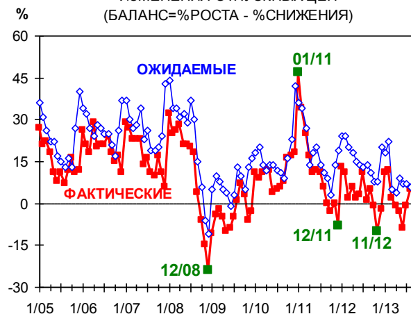
ИЗМЕНЕНИЯ ОТПУСКНЫХ ЦЕН (БАЛАНС=%РОСТА - %СНИЖЕНИЯ)

А ценовые прогнозы предприятий почти не меняются последние три месяца, сохраняют положительное значение (планы роста цен преобладают на планами их снижения), но остаются на самом скромном для последних двух лет уровне (планируемый рост ожидается самым умеренным с ноября 2011 г.).