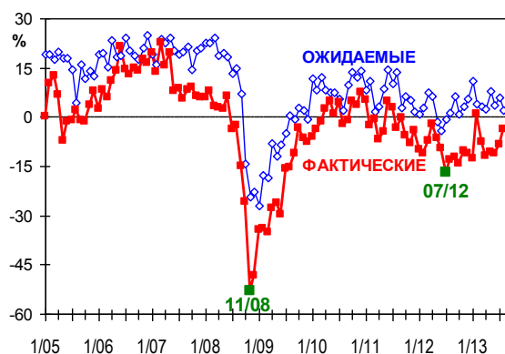
ИЗМЕНЕНИЯ ПЛАТЕЖЕСПОСОБНОГО СПРОСА, ОЧИЩЕННЫЕ ОТ СЕЗОННОСТИ (БАЛАНС=%РОСТ-%СНИЖЕНИЕ)

Однако прогнозы спроса на сентябрь-октябрь выглядят крайне пессимистично. Исходный баланс потерял за месяц сразу 6 пунктов и впервые в 2013 г. перестал быть положительным (ожидания снижения продаж сравнялись с ожиданиями их роста). Очистка от сезонности показало ухудшение баланса на 4 пункта. Заметим, что год назад августовские прогнозы показали скромное, но все-таки улучшение ожиданий в промышленности.