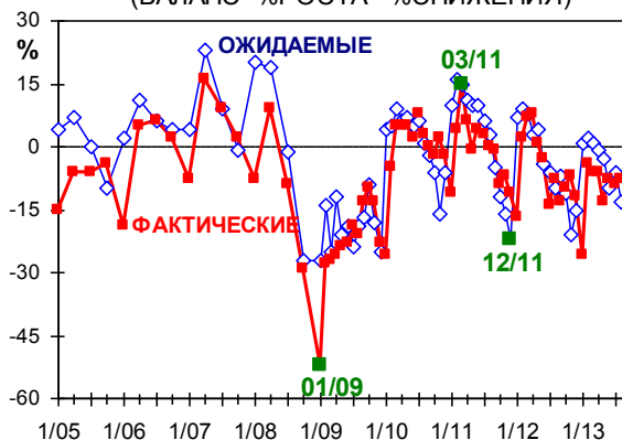
ИЗМЕНЕНИЯ ЗАНЯТОСТИ (БАЛАНС=%РОСТА - %СНИЖЕНИЯ)

Прогнозы изменения численности кадров не сулят промышленности ничего хорошего. Баланс показателя опустился в августе до годового минимума. Иными словами, отток работников продолжится, а обеспеченность возможным (начинающегося?) промышленного роста кадрами снизится.