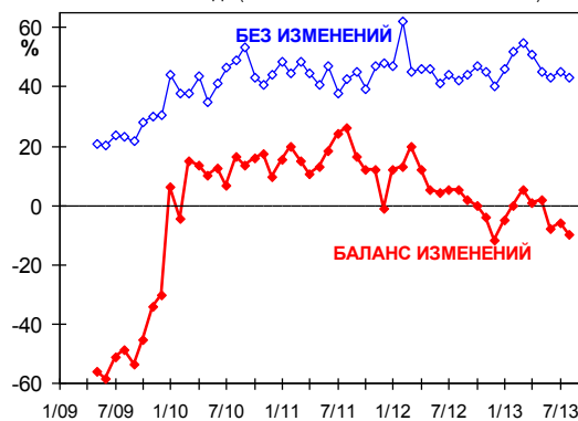
ОЖИДАЕМЫЕ ИЗМЕНЕНИЯ КАПВЛОЖЕНИЙ В ОСНОВНЫЕ ФОНДЫ, К ПРОШЛОМУ ГОДУ (БАЛАНС = %РОСТА -- %СНИЖЕНИЯ)