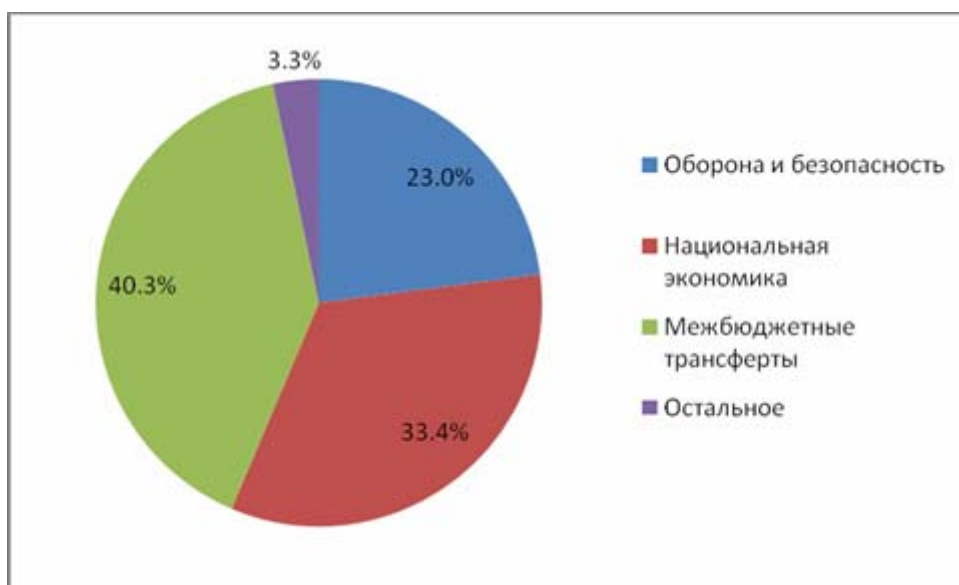
Рис. 2. Структура прироста федеральных расходов в 2009 г. по сравнению с 2008 г., в %

Рост трансфертов регионам носил в большой мере характер компенсации потерь региональных доходов и не мог привести к соразмерному росту расходов субъектов федерации. Действительно, при росте трансфертов за 5 месяцев на 294 млрд руб., региональные расходы увеличились только на 195 млрд. рублей, т.е. прирост расходов был на 30% меньше роста объемов федеральной помощи регионам. Большая часть прироста региональных расходов пошла на финансирование социальных нужд и, как представляется, наиболее прямым и действенным образом была направлена на поддержку внутреннего спроса. Региональные социальные расходы увеличились на 85 млрд. рублей, суммарные расходы на образование и здравоохранение (включая через территориальные фонды медицинского страхования) – на 90 млрд. Но возможности расширения региональных бюджетов в этом году по действующему законодательству в три раза ниже роста расходов, запланированного в федеральном бюджете.