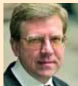
Алексей Кудрин, министр финансов РФ:

«Я еще два года назад предупреждал об опасности перегрева российской экономики.