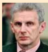
Андрей Фурсенко, министр образования и науки РФ:

«Наступило время осмысления того, что происходит в стране. Сейчас у нас появляется много документов, в которых рассматриваются концепции долгосрочного развития. Однако горизонт этих стратегий не превышает пяти —