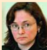
Эльвира Набиуллина , министр экономического развития и торговли РФ:

«Новая «технологическая волна» ожидает развитие страны уже к 2015 году. В течение нескольких лет будет практически полностью обновлена значительная часть используемых технологий во всех сферах экономики и человеческой деятельности на основе современных достижений в био-, нано- и IT-отраслях. Страны, не готовые к этой волне, будут де-факто отброшены на обочину мирового развития. Рынки инновационных наукоемких продуктов в перспективе будут расти быстрее мировой экономики в целом (около 10—20% по сравнению с 4—8%). В условиях быстрого распространения новых технологий в средне- и низкотехнологичные секторы страны, не «поймавшие» новую технологическую волну, станут стремительно отставать, в том числе по конкурентоспособности тех отраслей, где у них еще есть преимущества за счет низких издержек.