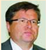
Алексей Улюкаев, первый заместитель председателя Банка России:

«Есть аргументы у тех, кто отмечает «перегретость» российской экономики, и у тех, кто говорит, что ее нет.