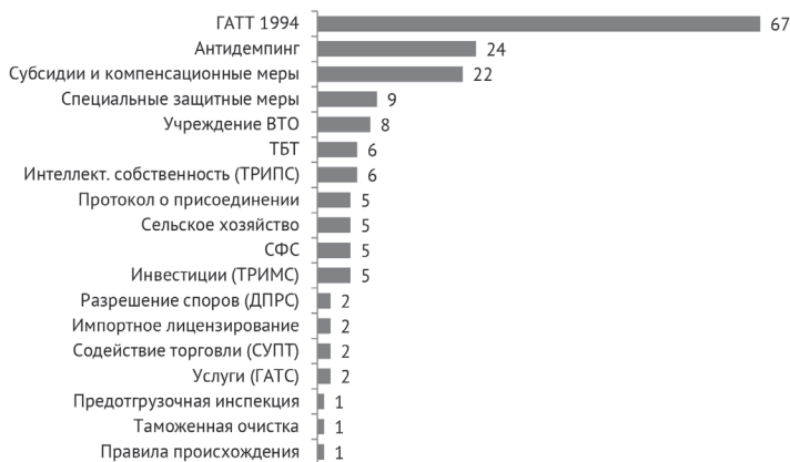
Рис. 2. Тематика по соглашениям споров ВТО, к которым Россия присоединилась в роли третьей стороны, по данным на конец 2022 г.

В среднем за прошедшие 10 лет участия в ВТО Россия присоединялась примерно к 10 спорам в год. Чаще всего Россия присоединяется к спорам по мерам, затрагивающим сельскохозяйственные и продовольственные товары, металлургическую, автомобильную и авиастроительную промышленность, химическую промышленность, древесину и изделия из нее, возобновляемые источники энергии (ВИЭ). Что касается соглашений, охватывающих споры, к которым Россия присоединилась в роли третьей стороны (один спор, как правило, охватывает несколько соглашений), то на рис. 2 и в табл. 14