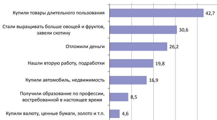
Рис. 3. Действия россиян за последние полгода, % от тех, кто их предпринимал (допускалось несколько ответов)

Таким образом, традиционная (архаичная стратегия) взяла верх над всеми остальными.