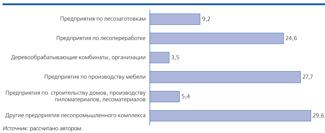
Рис. 1. Структура предприятий лесопромышленного комплекса Хабаровского края в 2020 г., в %

Ограничительные меры, введенные в 2020 г. в связи с пандемией коронавируса, выбили сферу лесозаготовления из привычной колеи. Низкие темпы роста товарного производства, лесопереработки, лесозаготовления стали тормозить уровень экспорта. В связи с упадком экономического состояния края сократился внутренний и внешний спрос на продукцию лесопромышленного комплекса. Но в 2021 г. ограничительные меры были сняты и лесопромышленный комплекс начал восстанавливаться после затяжного кризиса предыдущего года – стала проводиться модернизация предприятий, некоторые из них перешли на выпуск новых видов продукции, были реализованы пять приоритетных инвестиционных проектов в области освоения лесов, население получило рабочие места (повысилась его занятость). Совокупный экспорт продукции лесопромыш-