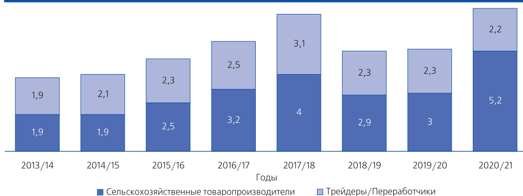
Рис. 1. Запасы пшеницы в сельхозорганизациях, заготовительных и перерабатывающих организациях, кроме малых, в ЦФО (на 01.01.2021 г.), млн т

но достигли исторически высокого уровня, в том числе на пшеницу – 17 тыс. руб./т с НДС [4]. Такая тенденция в росте цен прослеживалась впервые за всю историю зернового рынка. Фермеры начали покупать новую технику, строить складские помещения, весовые, зерносушилки и т.д. [1].