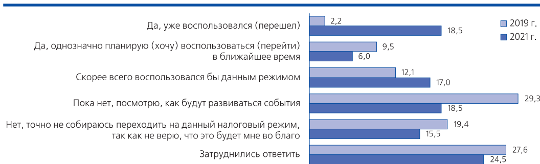
Рис. 5. Привлекательность нового налогового режима «Налог на профессиональный доход» для граждан, занятых частной практикой, в % от количества респондентов, занятых частной практикой