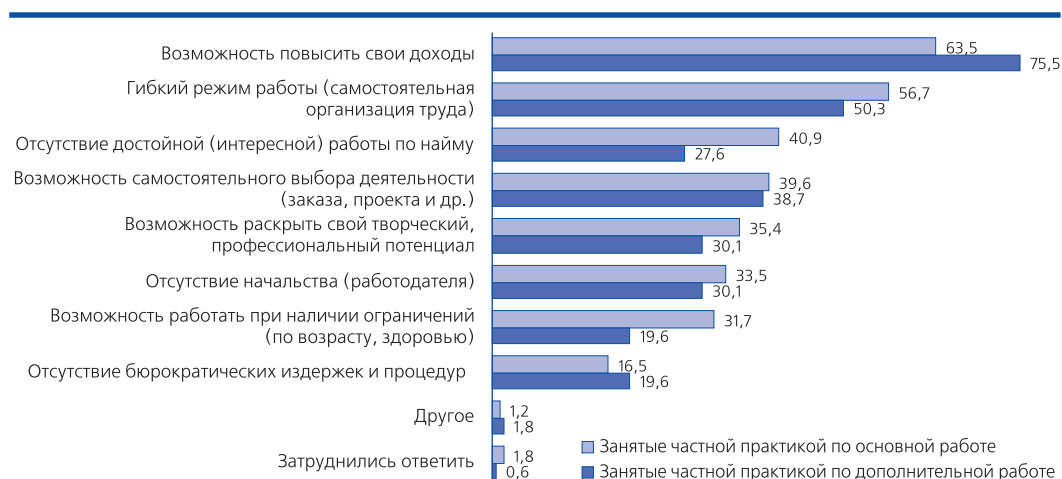
Рис. 1. Основные причины распространенности самостоятельной занятости на современном рынке труда, в % от количества ответивших по каждой выделенной категории

Природа феномена самозанятости сложна и противоречива, так как свобода в выборе заказчика и организации труда сочетается в нем с негарантированной и слабо защищен-