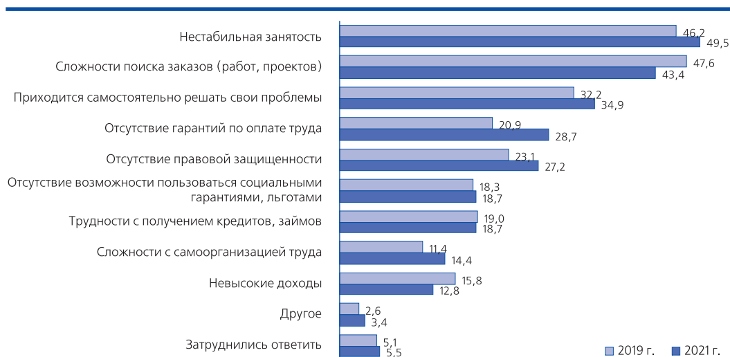
Рис. 2. Основные трудности ведения самостоятельной занятости по мнению занятых частной практикой, в % от количества респондентов, занятых частной практикой