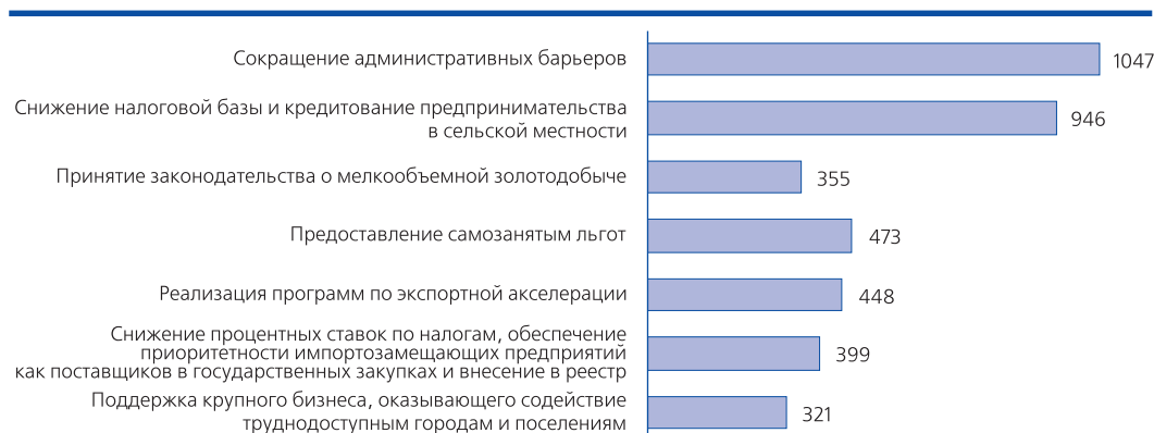
Рис. 4. Приоритизация предложений респондентов по развитию мер поддержки инвесторов и бизнеса в муниципальных образованиях, кол-во ответов