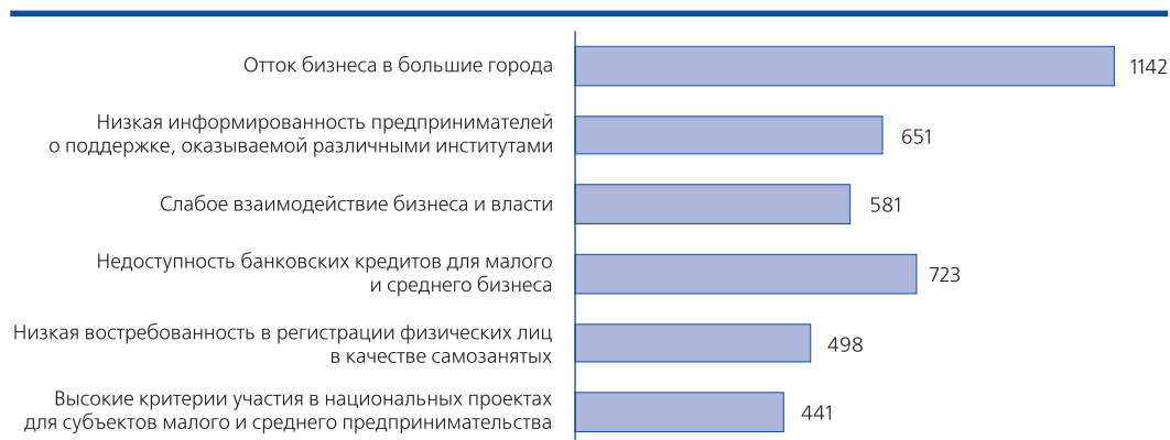
Рис. 3. Приоритизация проблем муниципалитетов в области поддержки инвесторов и предпринимателей, кол-во ответов