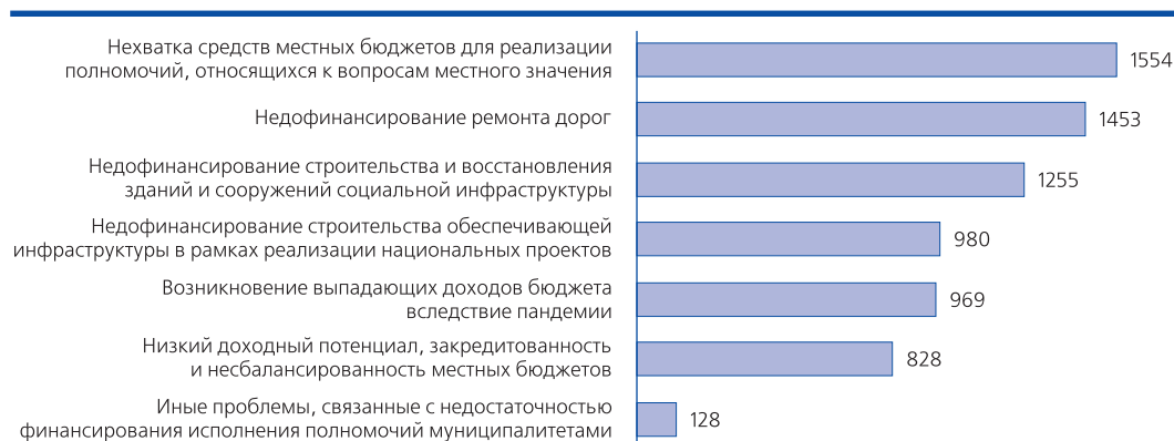
Рис. 1. Приоритизация проблем респондентов, связанных с недостаточностью финансовой обеспеченности муниципальных образований, кол-во ответов