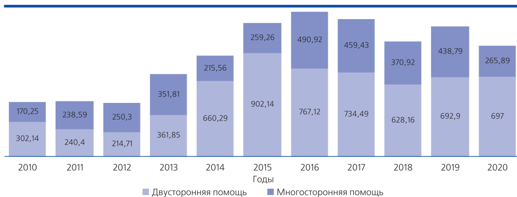
Рис. 2. Распределение российской помощи по многосторонним и двусторонним каналам финансирования в 2010–2020 гг., млн долл.