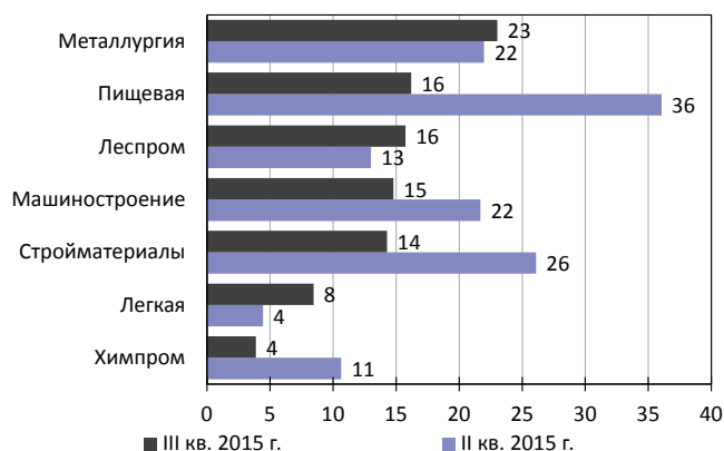
Рис. 1. Масштабы фактического импортозамещения при закупках сырья и материалов в отраслях промышленности, %

Все другие отрасли не смогли добиться даже такого результата. А самый значительный отказ от политики импортозамещения пришелся, что неожиданно, на пищевую промышленность. Если во II кв. 2015 г. долю закупок импортного сырья сократили 36% предприятий отрасли, то в III кв. это смогли сделать только 16%, в результате отказ от импортозамещения в отрасли составил 20 п.п. Хотя планы на III кв. предполагали импортозамещение в закупках сырья у 31% предприятий. Пла-