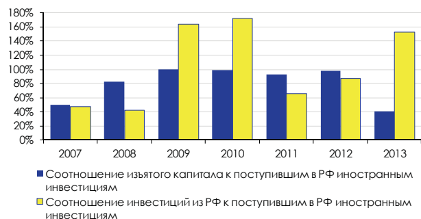
Рис. 1. Иностранные инвестиции в российскую экономику в I квартале 2007–2013 гг., млн долл.