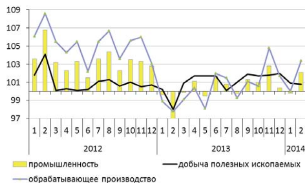
Рис. 1. Динамика физического объема выпуска по базовым видам экономической деятельности в 2012–2014 гг., в % к соответствующему периоду предыдущего года