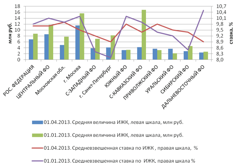
Рис. 5. Средневзвешенные данные по ИЖК в рублях, выданным с начала года по регионам