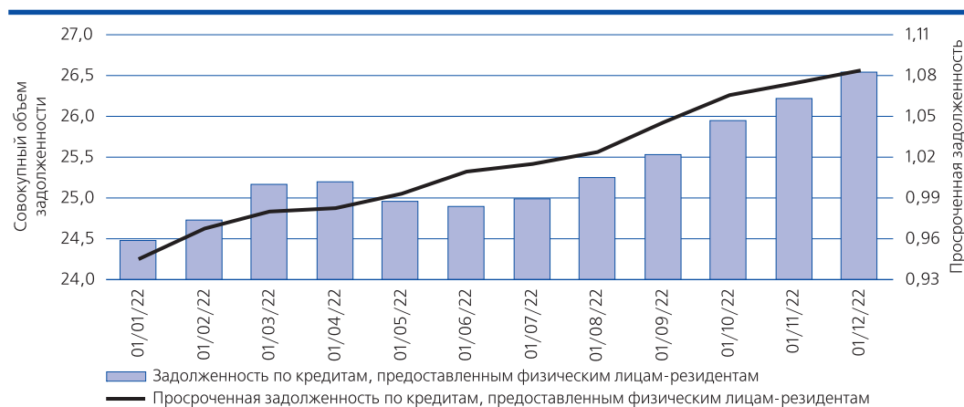
Рис. 2. Совокупный объем задолженности и просроченная задолженность по кредитам, предоставленным физическим лицам-резидентам, трлн руб.

Источник: URL: https://www.cbr.ru/vfs/statistics/BankSector/Mortgage/02_05_Debt_ind.xlsx